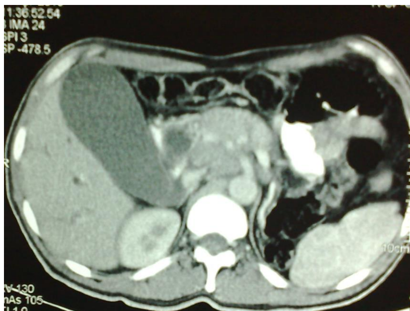
Conferir figura correspondente com melhor resolução no anexo (FIGURAS 1)

Baseado nas informações do caso e das imagens, a melhor conduta inicial para essa paciente é: