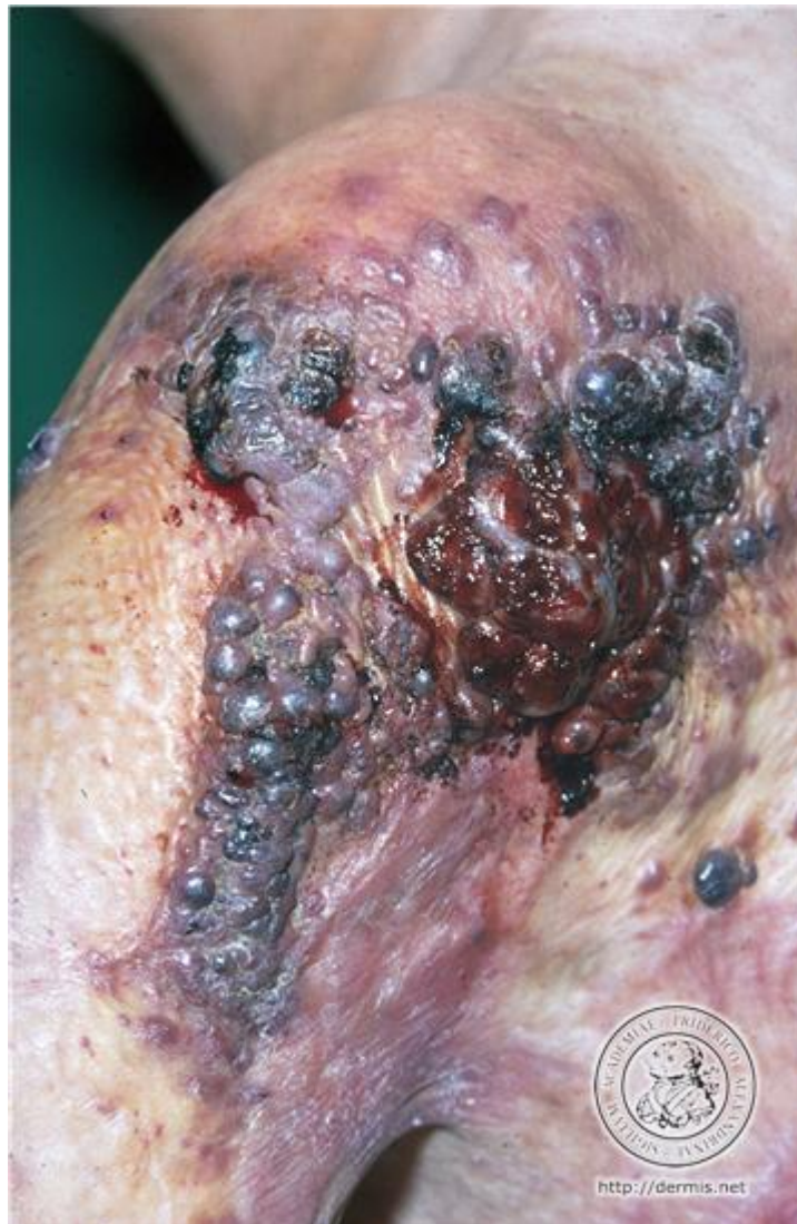
Conferir figura correspondente com melhor resolução no anexo (FIGURA 2)

Baseada nesses dados, a hipótese diagnóstica mais provável é: